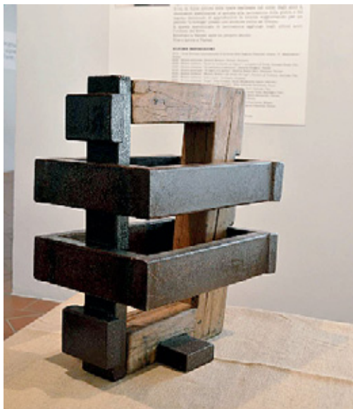
Un'opera in legno in mostra a Voltorre

mi abbandona mai e negli ultimi l'ho unito al ferro, mentre ho lasciato il marmo. L'arcaicità, l'impiego di materiali che accompagnano l'uomo da millenni, è la chiave della mia scultura. Assieme alla semplicità della forma, che porta l'opera a durare nel tempo e a essere nuova anche nel futuro», spiega l'artista, che non ama la tecnologia e