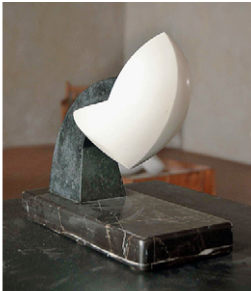
Un'opera in marmo, materiale poi abbandonato

«Quando in Centro America diedi il primo colpo di scalpello, capii subito che la mia strada sarebbe stata questa». Racconta i primi passi, le prime emozioni: «Raccoglievo grandi pezzi di legno lasciati dal mare e li lavoravo, spedivo a casa le sculture e nel 2004 partecipai alla prima collettiva a Torino. Il legno è la passione di sempre, non