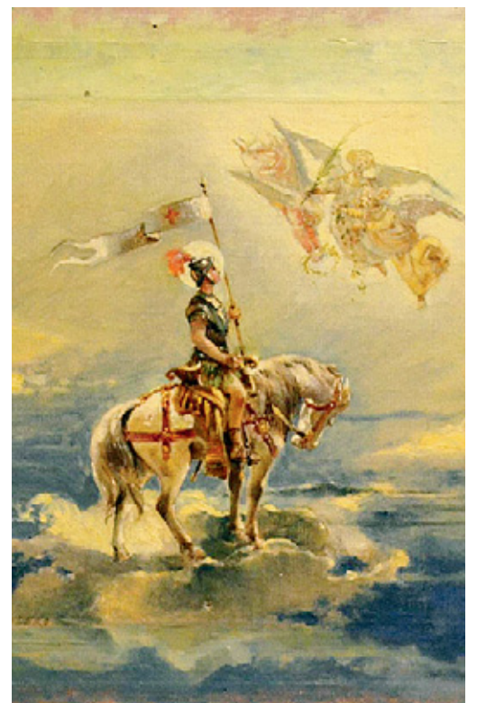
San Vittore di Bizzozero